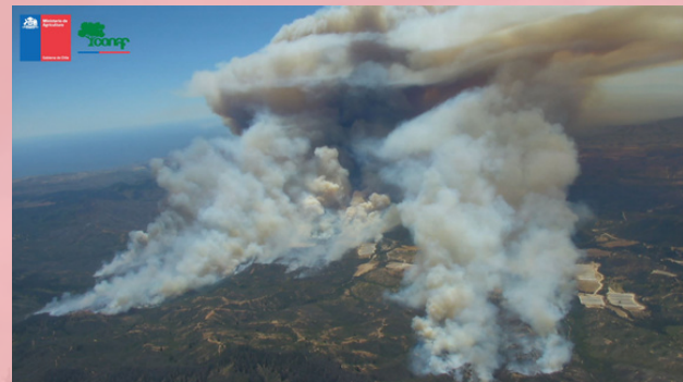
Figura 4. Complejo de incendios 221-La Engorda R.N.L.P, 223-Hacienda Las Palmas y 224-Hacienda las Palmas 2, región de Valparaíso

En la Figura 3 se muestra el mapa de Botón Rojo para la semana del 14 al 21 de enero de 2021. Se activó esta alerta para la comuna de Quilpué el día 15 de enero, coincidiendo el área delimitada por el Botón Rojo con la zona en la que se desarrolló el complejo de incendios “La Engorda R.N.L.P”, “Hacienda Las Palmas” y “Hacienda las Palmas 2” en la región de Valparaíso (Figura 4), con una superficie afectada total de 3.960 hectáreas, generando una carrera de 8 km de avance del fuego en dirección a la comuna de Quilpué. Ante esta situación, 5 poblaciones fueron evacuadas de forma preventiva antes de la llegada del incendio.