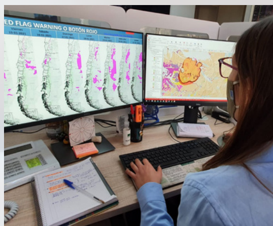
Figura 1. Sección de Análisis y Predicción de Incendios Forestales (SAPIF)

El Botón Rojo es elaborado por la Sección de Análisis y Predicción de Incendios Forestales (SAPIF) de la Corporación Nacional Forestal (CONAF), para informar a los organismos que forman parte del Sistema de Protección Civil y a la ciudadanía la existencia de condiciones favorables para la ocurrencia y propagación de incendios forestales de magnitud. Con esto, la CONAF incorpora una nueva herramienta tecnológica para la prevención y planificación ante emergencias por incendios forestales.