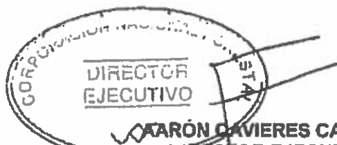
AARÓN CAVIERES CANCINO DIRECTOR EJECUTIVO CORPORACIÓN NACIONAL FORESTAL

o que transcribo a Ud. para su conocimiento aluda atentamente a Ud.